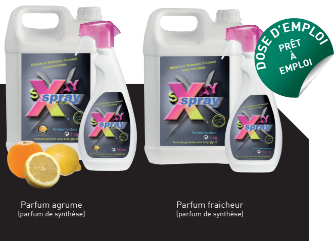
Parfum agrume (parfum de synthèse)