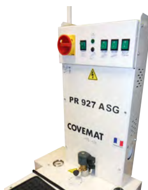
Coffret électrique centralisé