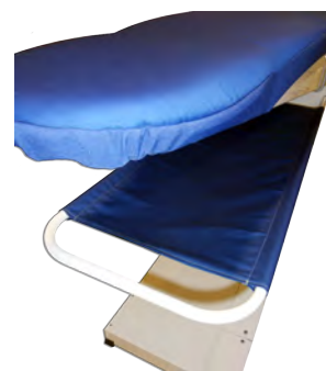
Toile berceau tendue